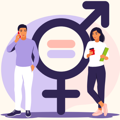
आयु और लिंग