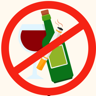
तम्बाकू और शराब का सेवन