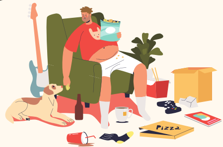
जीवनशैली कारक (शारीरिक गतिविधि की कमी, अस्वास्थ्यकर आहार और धूम्रपान)