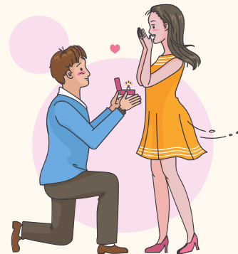
कम उम्र में विवाह और एक से अधिक यौन साथी